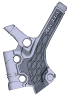
A - (1 PCS)