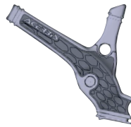
B - (1 PCS)