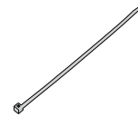
C - (6 PCS)